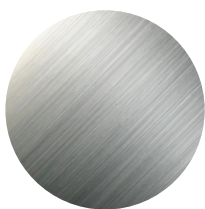
stal nierdzewna INOX