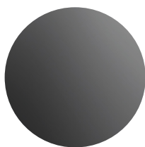
stal nierdzewna lakierowana (paleta RAL)

Przedstawione informacje są aktualne w chwili ukazania się niniejszej publikacji. GASTOP zastrzega sobie prawo do zmian w ofercie w zakresie oferowanych modeli jak i ich budowy oraz wyposażenia. Niniejszy dokument nie stanowi oferty w rozumieniu prawa i publikowany jest jedynie dla celów informacyjnych.